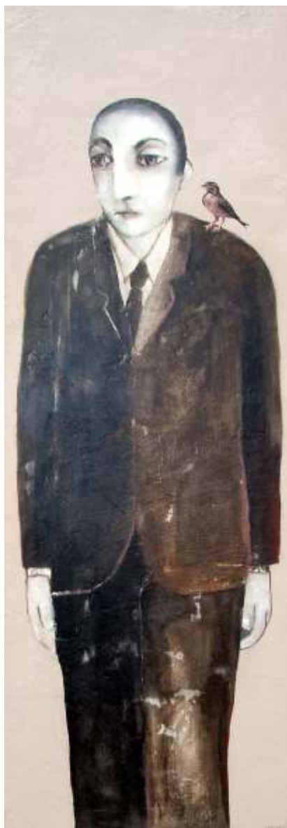
DÍPTICO 146 X 166 CM TÉCNICA MIXTA SOBRE MADERA