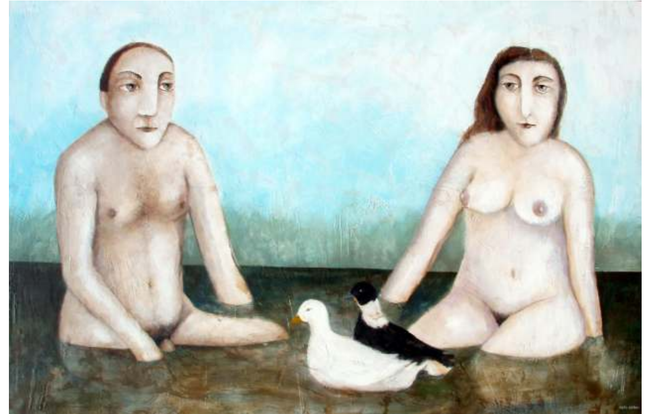
ESTANQUE 97 X 146 CM TÉCNICA MIXTA SOBRE MADERA