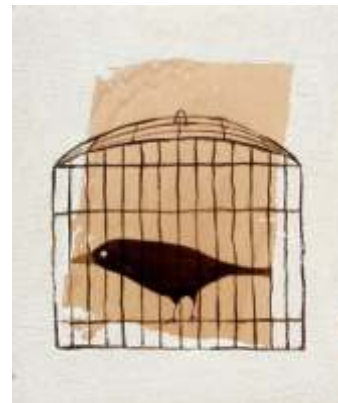
PÁJARO I N 48 X 40 CM TÉCNICA MIXTA SOBRE MADERA