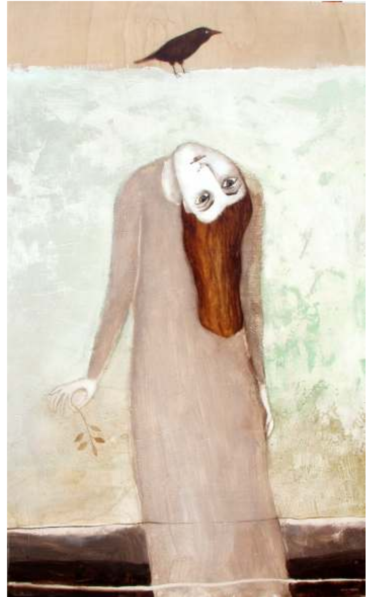
MIRLO 146 X 89 CM TÉCNICA MIXTA SOBRE MADERA