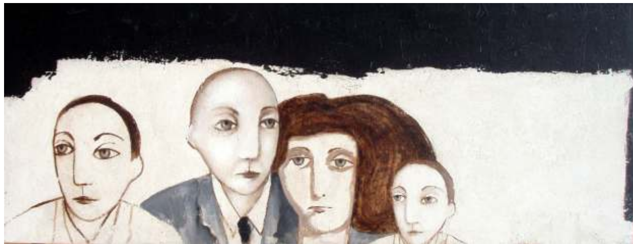
HOMBRE 48 X 122 CM TÉCNICA MIXTA SOBRE MADERA