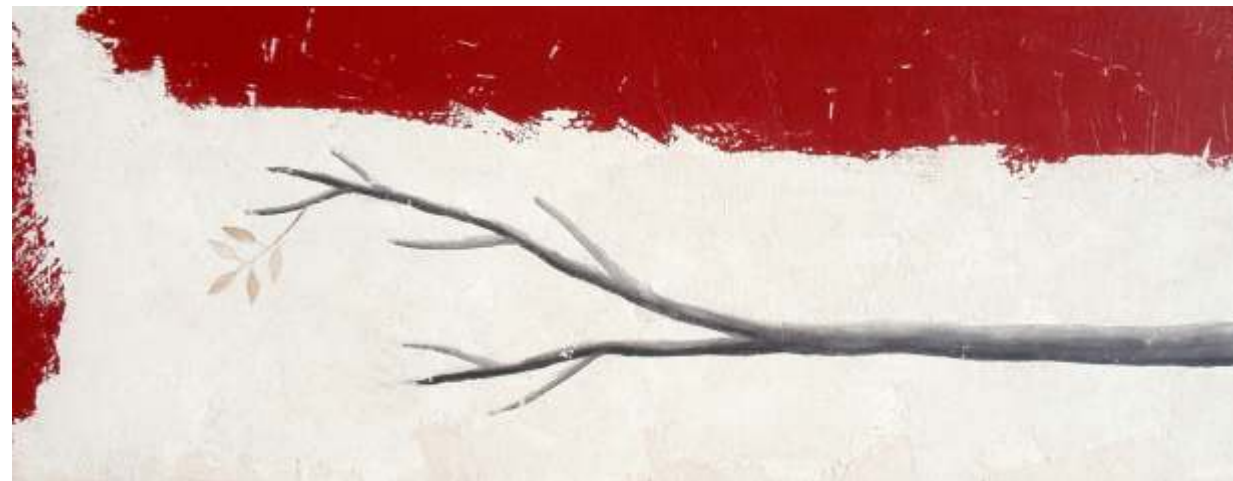
ÁRBOL 48 X 122 CM TÉCNICA MIXTA SOBRE MADERA