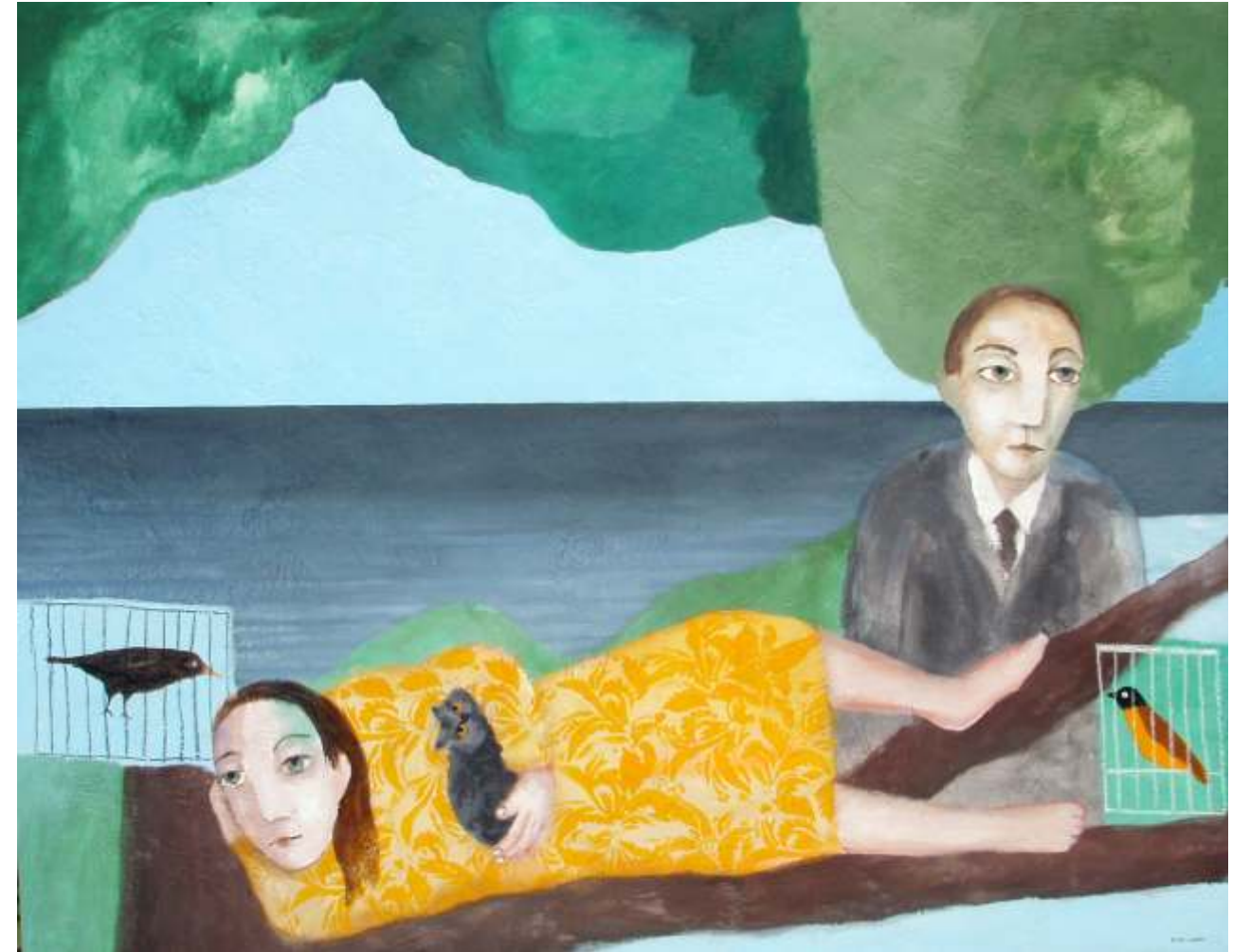
MAR 122 X 154 CM TÉCNICA MIXTA SOBRE MADERA