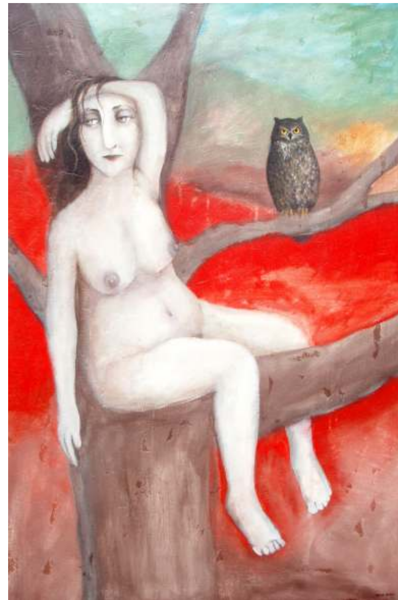
BÚHO 146 X 97 CM TÉCNICA MIXTA SOBRE MADERA