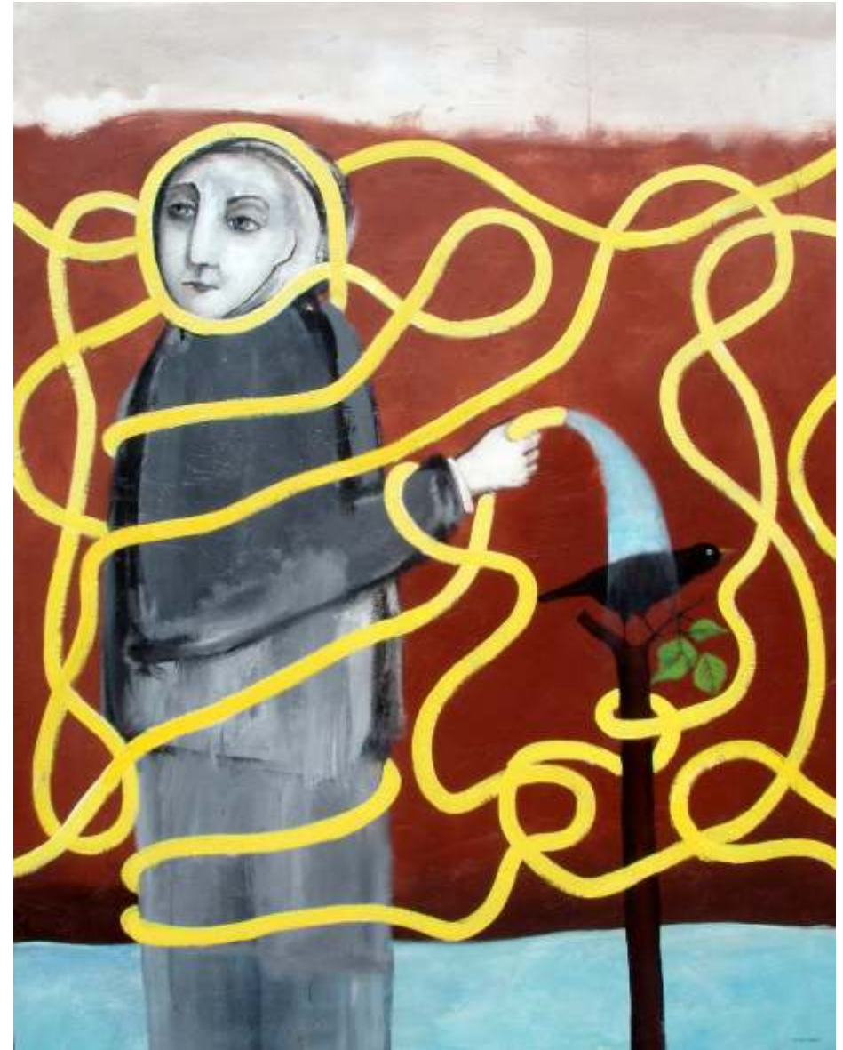
BAÑO DEL MIRLO 146 X 114 CM TÉCNICA MIXTA SOBRE MADERA